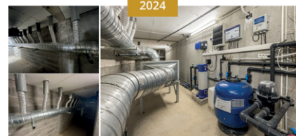
CARRÉ BLEU VANNES