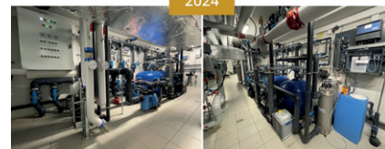
CARRÉ BLEU FULLY/GENÈVE