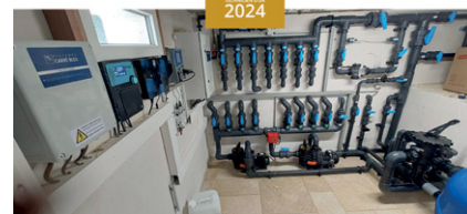
CARRÉ BLEU POITIERS